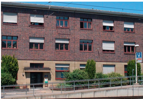
Das Beratungszentrum Jugend und Familie Wangen.

Telefonische Auskunft und Beratung: Montag, Dienstag und Mittwoch 9 bis 16 Uhr Donnerstag 9 bis 18 Uhr Freitag 9 bis 12.30 Uhr Bereitschaftsdienst: Freitag bis 16 Uhr