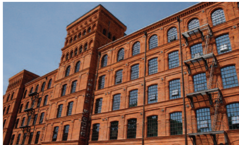
Das Andel's Hotel in Lodz befindet sich in einer ehemaligen Weberei der Textilmetropole.

Heute hat sich die Lodzer Wirtschaft wieder gefangen, und die Stadt hat sich zu einer modernen Metropole entwickelt: Die Piotrkowskastraße in der Innenstadt ist mit ihren 4,9 Kilometern, zahlreichen Cafés und Straßentheatern als längste Einkaufsstraße Europas und längste Fußgängerzone Polens bekannt. Ein Teil der Straße ist für den Autoverkehr gesperrt, Fußgänger und Fahrradfahrer – ein populäres Transportmittel für Einheimische und Touristen – dominieren das Bild. Der Reichtum aus früheren Tagen ist hier noch deutlich zu spüren: Gründerzeitvillen, Fabrikgebäude in Backsteinarchitektur und prachtvolle Fassaden säumen den Weg.