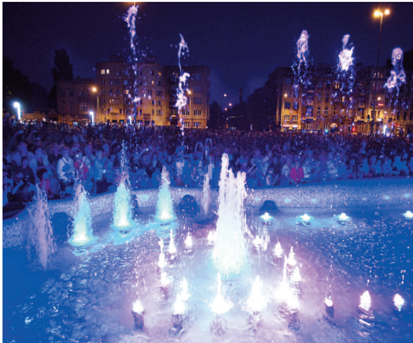
Fontäne am Platz Dabrowskiego bei einer Kulturveranstaltung

Dies alles bildete den Ausgangspunkt einer Vielzahl von gemeinsamen Kulturprojekten, Konzerten und Theateraufführungen. Aktive Einrichtungen wie arcata stuttgart, Pentaton Kulturnetz e. V., die Landsmannschaft Weichsel-Warthe, Landesverband Baden-Württemberg, Kreisgruppe Stuttgart, der Verein für internationalen Kulturaustausch – Künstlerwege e. V., um nur einige zu nennen, haben die Partnerschaft Lodz-Stuttgart lebendig gestaltet.