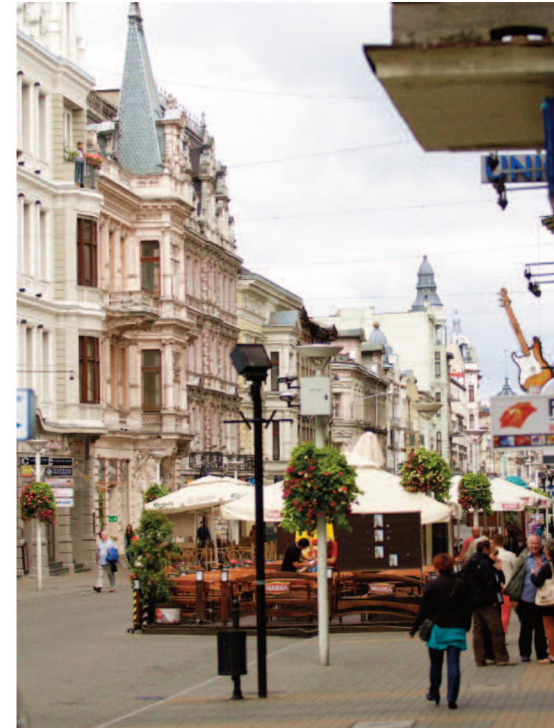
Die prachtvolle Piotrkowskastraße ist die längste Einkaufsmeile Europas.

Lodz gehörte dank seiner vergleichsweise intakten Wirtschaftsstruktur zu den wichtigsten polnischen Städten der Nachkriegszeit und wurde nach dem Krieg auch für kurze Zeit „Ersatzhauptstadt“ für das vollständig zerstörte Warschau.