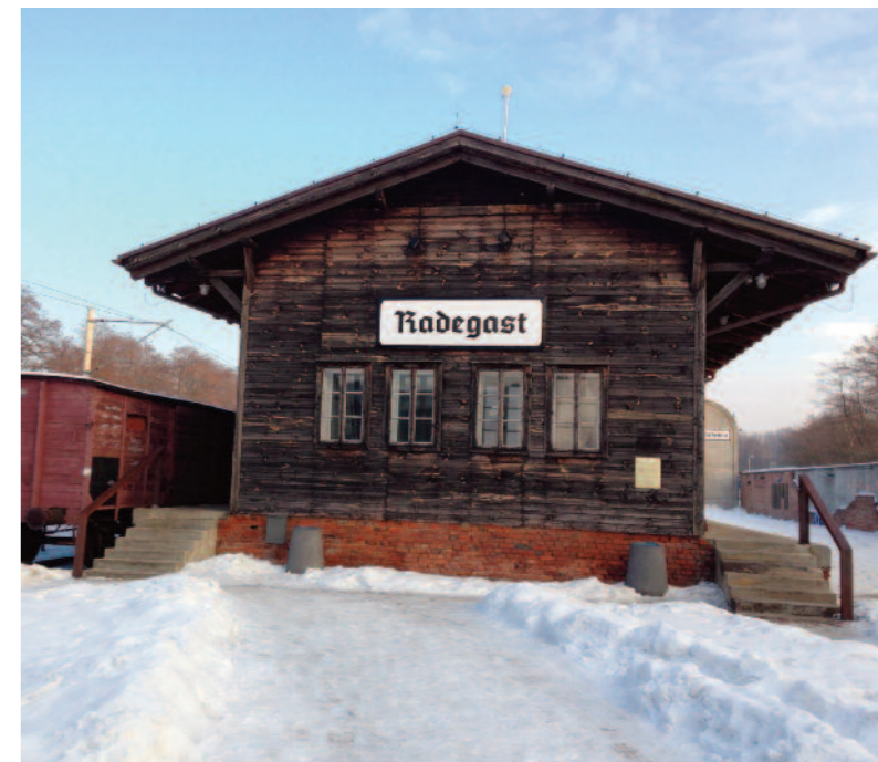
Der Bahnhof Radegast, die ehemalige Bahnstation in Lodz, ist seit 2004 eine Gedenkstätte.