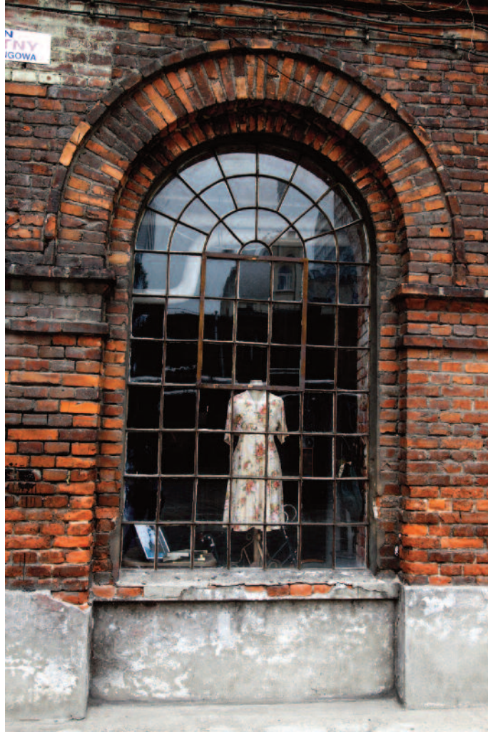
Historische Backsteinfassade in Lodz