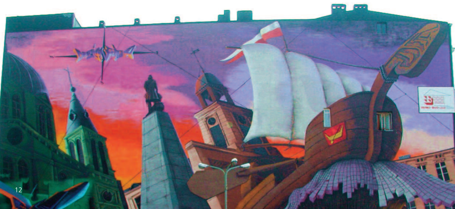
Junge Graffiti-Kunst in Lodz