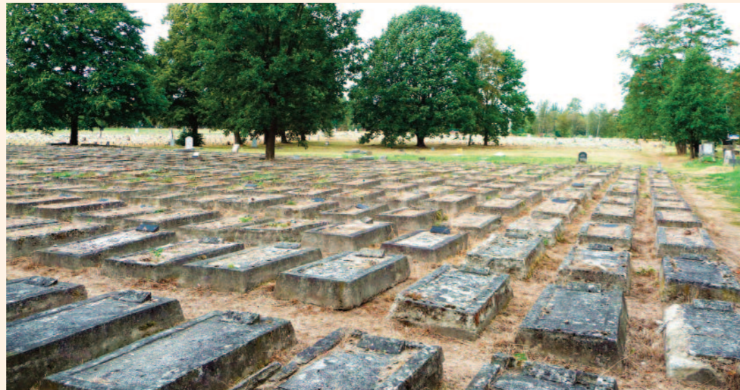
Der jüdische Friedhof in Lodz: 1944 wurde beinahe die gesamte jüdische Bevölkerung der Stadt Lodz deportiert und ermordet.

Die Lodzer definierten sich über ihre Stadt, die Zusammenarbeit für den persönlichen Erfolg sowie den der Stadt, nicht über ihre Zugehörigkeit zu einer Nationalität oder Religion. „Nicht das Herkommen, sondern das Fortkommen war von Bedeutung“ (Schlögel). Der Zweite Weltkrieg zerstörte die Errungenschaften des Lodzermenschen auf einen Schlag: Lodz war nun keine multinationale, multikulturelle und multikonfessionelle Stadt mehr.